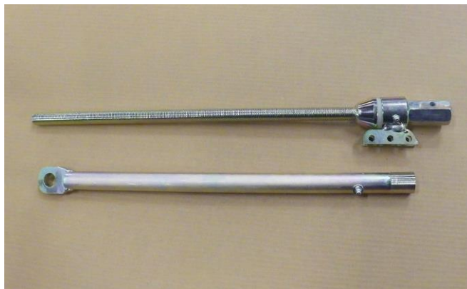
Obrázek 6. Opravná sada napínáku kolopásů.